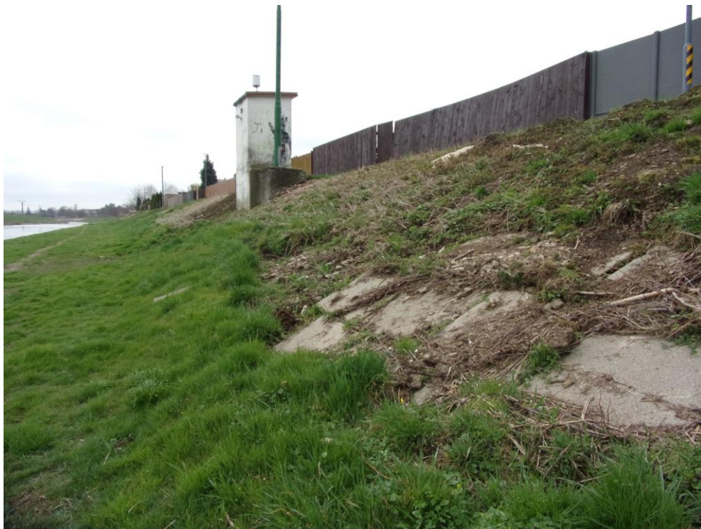
Pohled na PB objekt limnigrafu (směrem po toku)