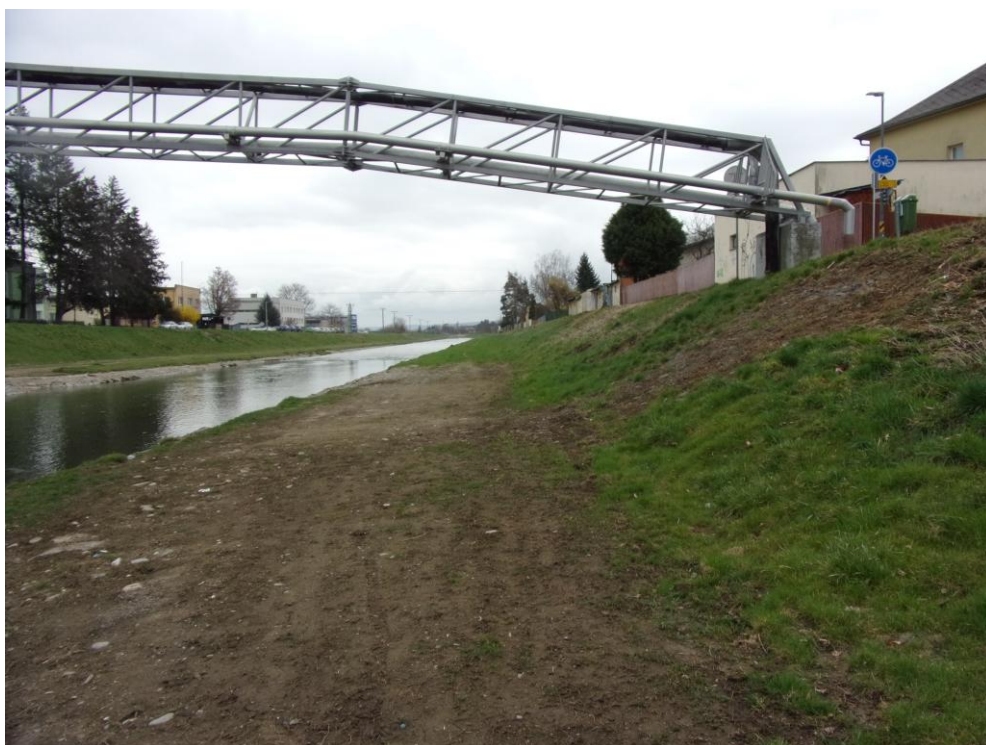
Pohled na PB část trubního mostu (směrem po toku)